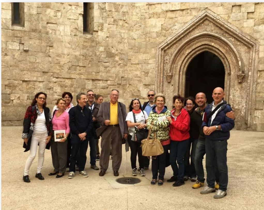
Il gruppo dei partecipanti nel cortile interno di Castel del Monte

Con gli allievi e simpatizzanti in questi luoghi sacri e ricchi d'esoterismo e di storia, sono stati ricercati e verificati i percorsi delle ley-lines e dei corsi d'acqua sotterranei, ed i presenti hanno constatato come questi edifici di culto, siano stati costruiti e centrati perfettamente su punti d'alta energia della terra, e come ancora oggi dopo secoli emanino delle forze che possono agire in modo benefico sulla parte psicofisica e spirituale dell'uomo.