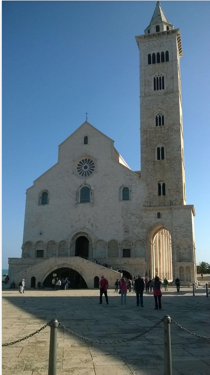
Cattedrale di Trani

L'incontro è stato soddisfacente e molto costruttivo per tutti i gitanti, ed alcuni allievi hanno dimostrato di saper decodificare le varie radianze emesse da quei luoghi.