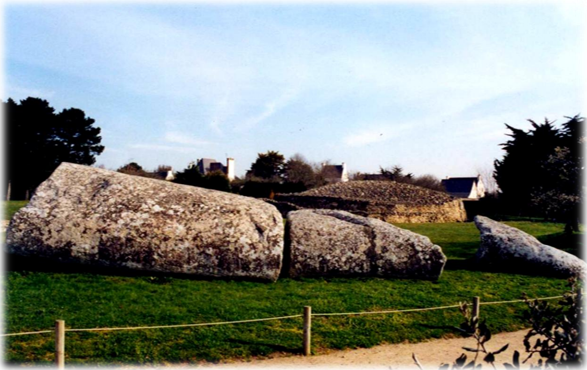
Il menhir più alto del mondo

Naturalmente tutti gli allievi hanno trovato ottimi spunti per verificare e studiare il posizionamento e l'impiego energetico e rituale di questi enormi massi di pietra eretti dall'uomo nell'era neolitica tra i 3.000 ed i 5.000 anni fa, e di fare nuove scoperte nel