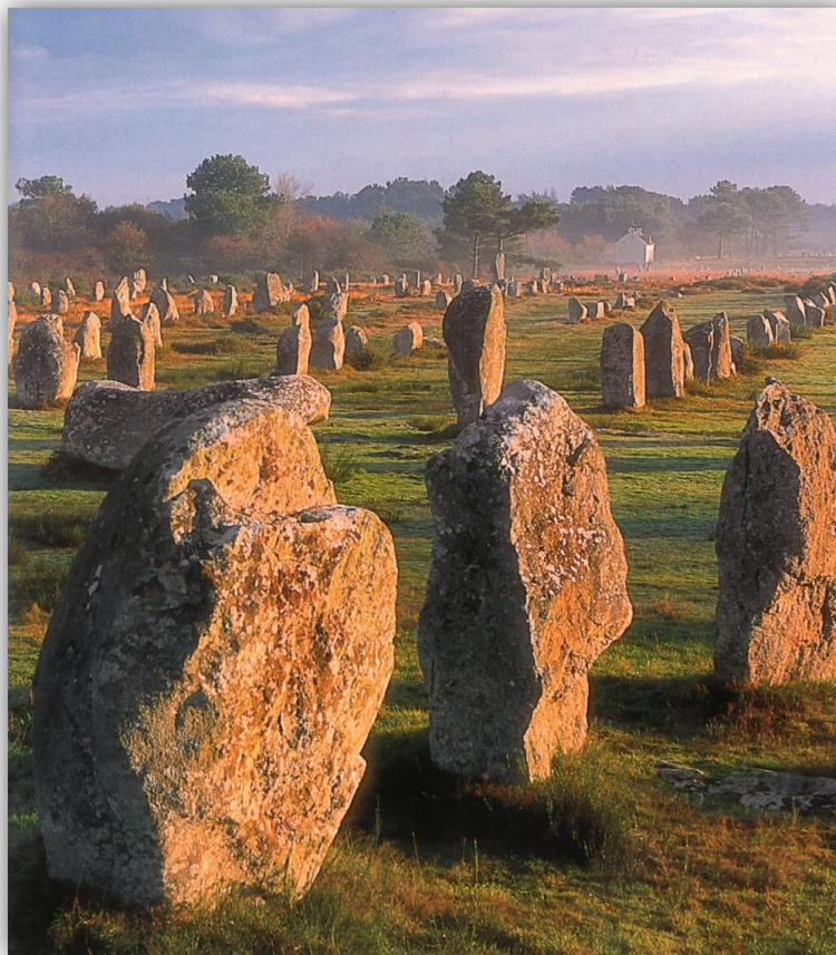
Gli allineamenti di Carnac