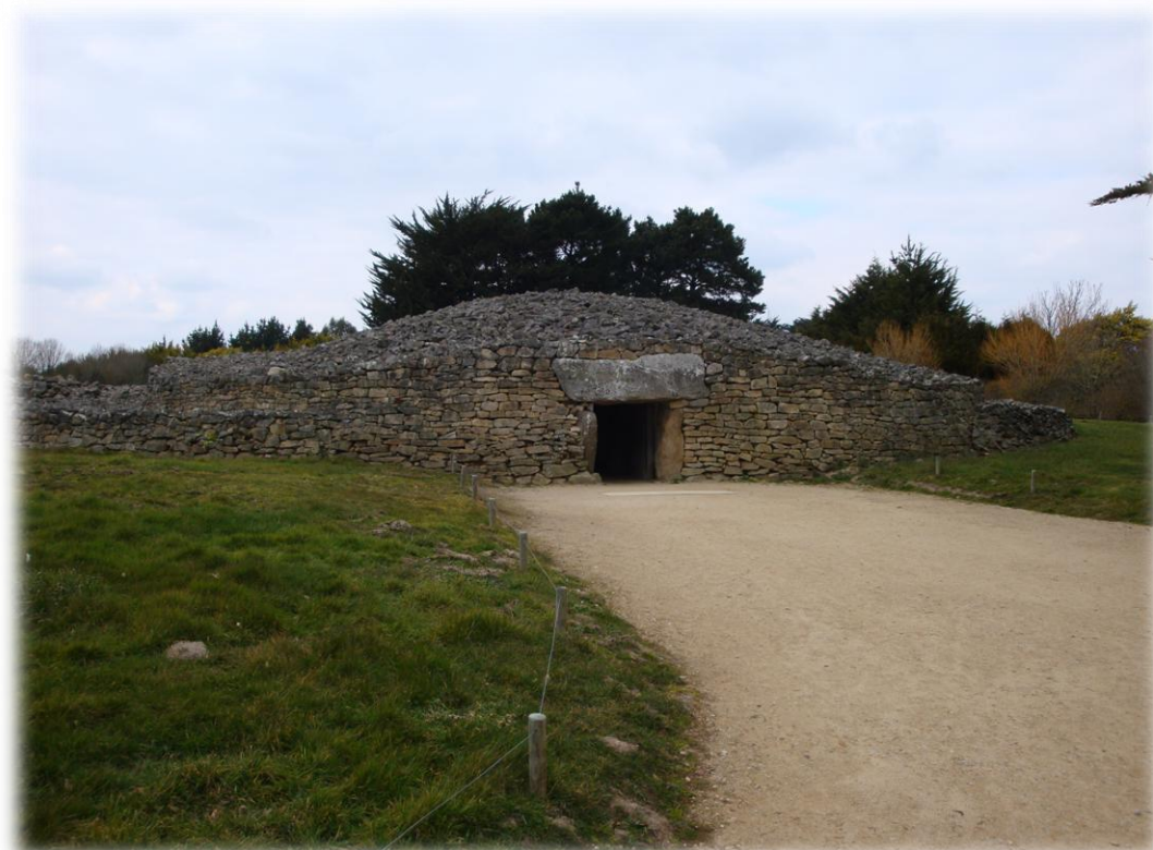
Il tumulo di sepolturadi Locmariaquer

E quello di Locmariaquer, nel quale esiste anche il menhir più alto del mondo.