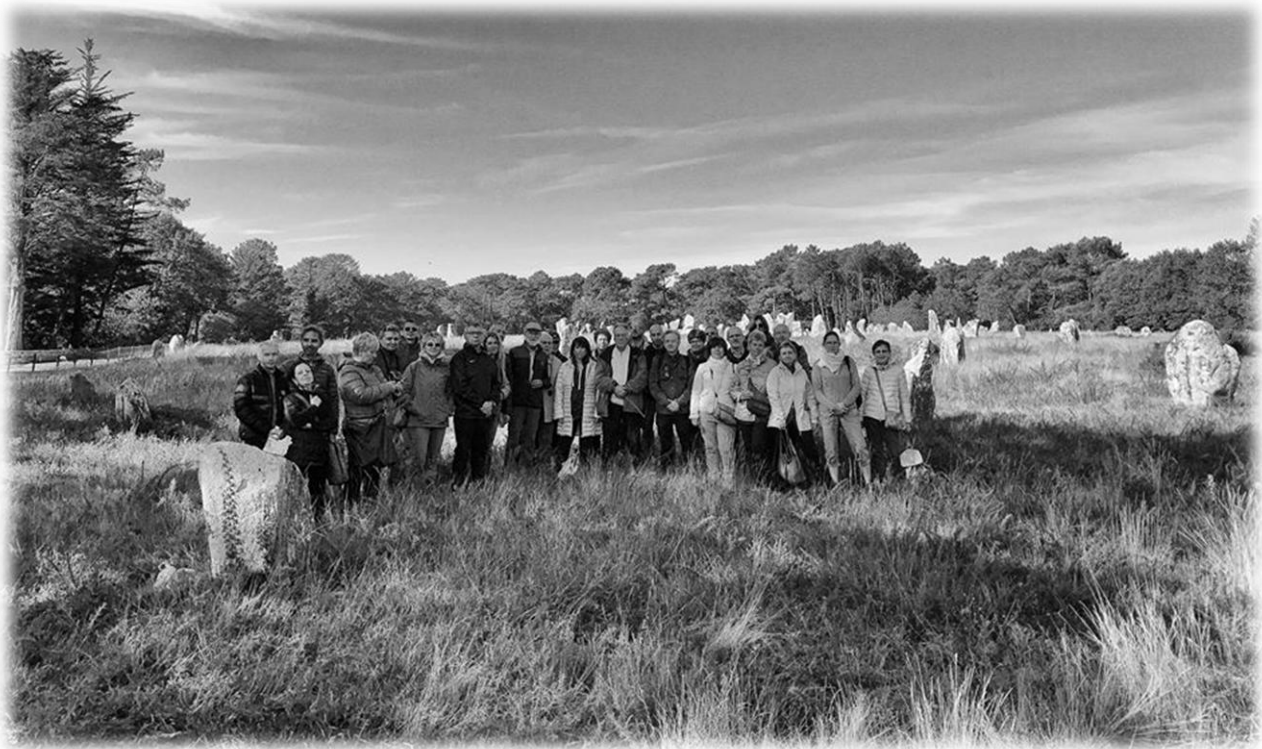
Il gruppo di partecipanti

Organizzata dall'ARIS – Associazione Radioestesisti Italiani e Sourciers