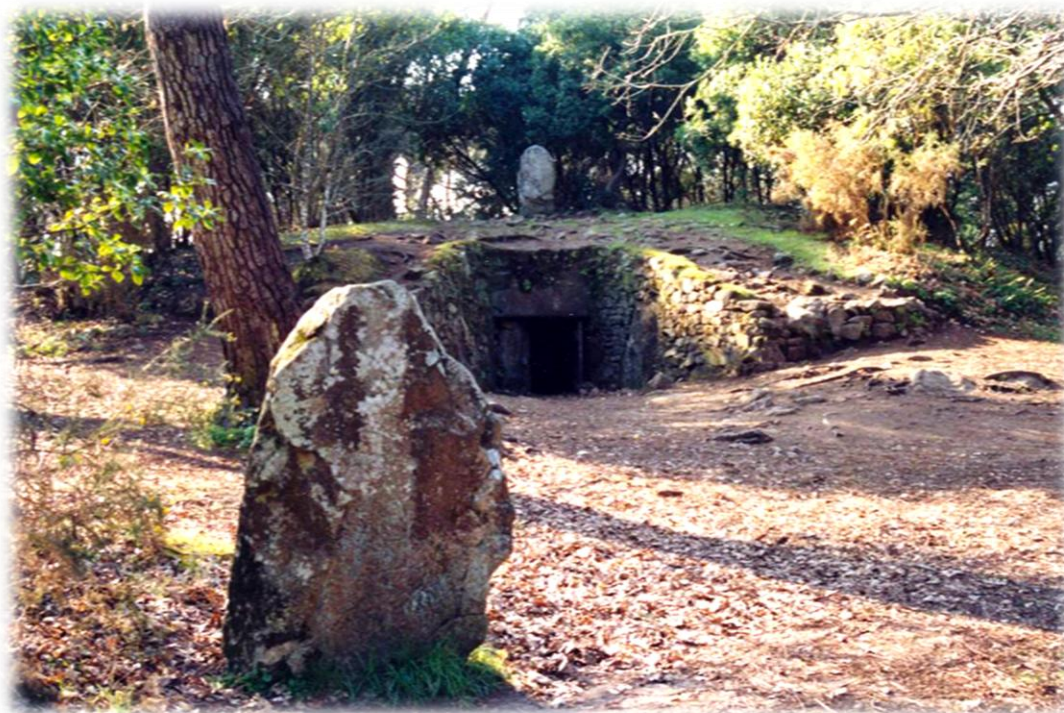
Il tumulo di ritualità di Kercado

Inoltre sono esistenti dei tumuli di ritualità e sepoltura come quello di Kercado ed altri.